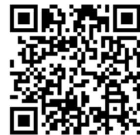
笠寺ポータルサイト

電話: 052-822-0885 mail: kasadera@minamix.net URL: http://machiwiki.sakura.ne.jp https://www.facebook.com/monzentei