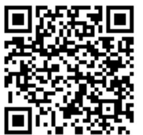
フェイスブックページ